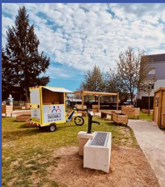
jardin partagé

Le bailleur Habitat Eurélien et la Régie de Quartier Reconstruire Ensemble renforcent leur coopération à Mainvilliers, à travers une troisième convention, dotée de 35 000 € pour financer des actions de lien social dans le quartier Bretagne. Parmi les réalisations récentes, l'inauguration le 9 avril d'un jardin partagé de 500 m 2 , pensé comme un espace ouvert favorisant à la fois le jardinage, les rencontres et les initiatives collectives. La Régie, implantée depuis 25 ans sur le territoire, en assure l'animation au quotidien. Ce partenariat s'inscrit dans le cadre de l'utilisation de l'abattement de la taxe foncière sur les propriétés bâties (TFPB), permettant de financer des actions de gestion urbaine et sociale de proximité : transition écologique (collecte de biodéchets), amélioration du cadre de vie, convivialité et médiation.